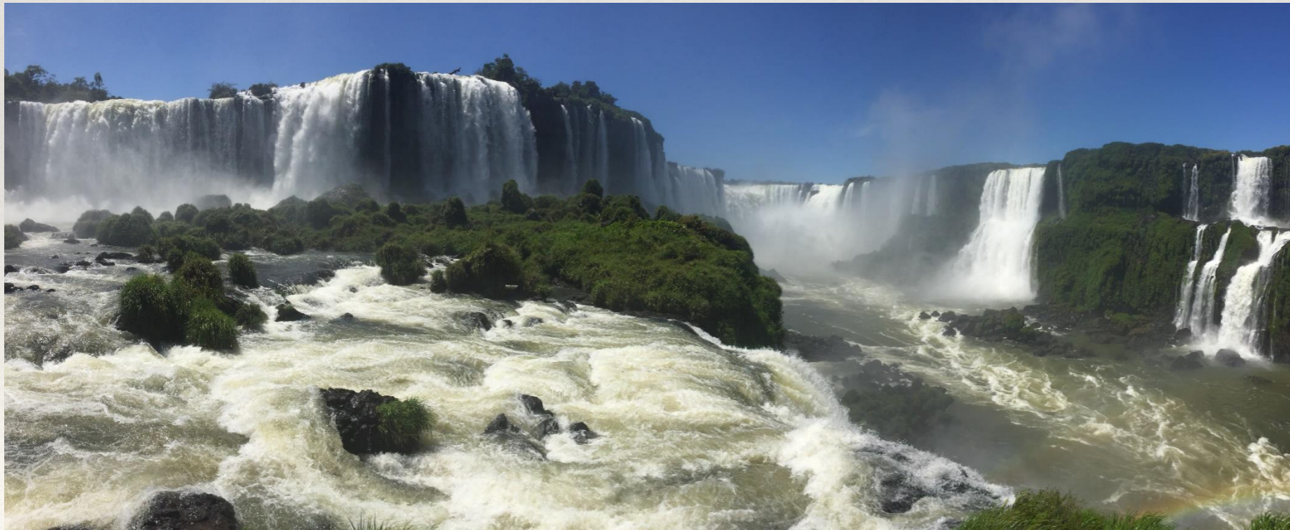
Cataratas de Iguazú Argentina